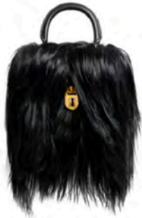
Droomdecor — p. 23