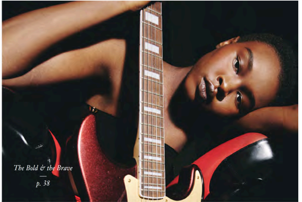
The Bold & the Brave — p. 38