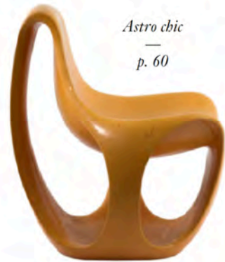
Astro chic — p. 60