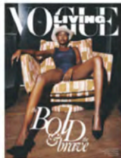
COVER Creative CHARISSA HOGERHEIJDE