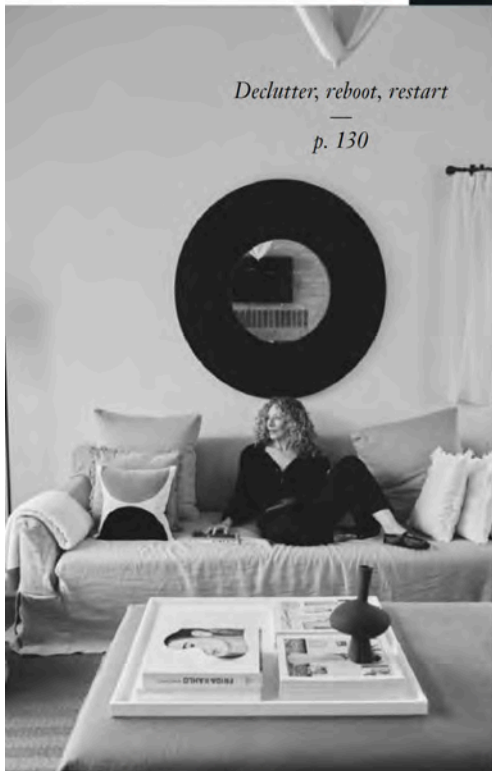
Declutter, reboot, restart — p. 130